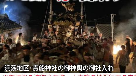
浜荻地区・貴船神社の御神輿の御社入れ