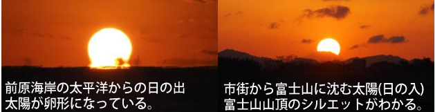
前原海岸の太平洋からの日の出 市街から富士山に沈む太陽(日の入)太陽が卵形になっている。富士山山頂のシルエットがわかる。

鴨川市に天文台をつくらう会 日本全国で公開天文台をもたない唯一の県である千葉県に位置する鴨川市に公開天文台を誘致すべく発足した団体。30年以上にわたって市民向けの観望会を開くなど、天文への啓発活動を地道に展開している。