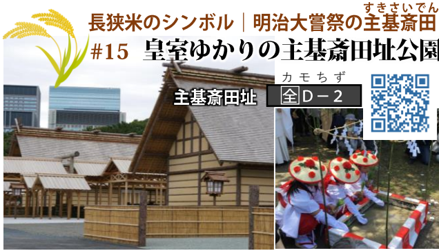
▲ 令和の大嘗祭に使用された悠紀殿 ▲ 御代替わりを記念して(手前)と主基殿(奥)。仮設の建物として 開催された令和元年主基皇居・東御苑に設営されました。 齋田お田植え祭りのようす

お問合せ・お申込 / 鴨川市ふるさと回帰支援センター 受付 / 平日9:00~17:00 休日 / 土・日曜・祝日 鴨川市横渚1450 鴨川市役所3階 ☎ 04-7094-4600 ☎ 04-7094-4601 info@furusato-kamogawa.net