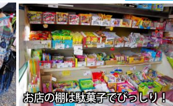
イベント出店のようす