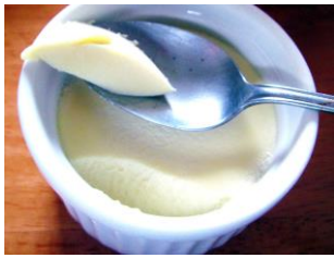
蒸しチッコカタメタノ

アジア型近代化遺産であり、「人々を元気に!」を牽引し続けた嶺岡牧は、世界の将来を築く導きの糸であり、世界遺産をしのぐ宝との評価を得ている。この嶺岡牧物語を構成する様々な文化を活かして地域を元気にする活動へ、自治体がサポートする体制の整備が希求される。