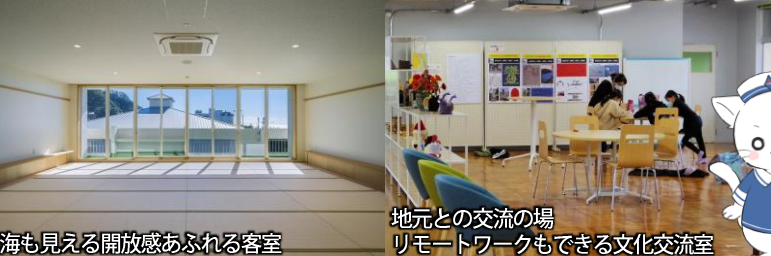
海も見える開放感あふれる客室

旧小湊小学校を改装し、2022年2月に誕生した「小湊さとうみ学校」で4月1日より新たに宿泊事業がスタートした。校舎の面影を残した交流棟では、3階に和室の大部屋5室、洋室の個室8室があり、最大116名が宿泊できる。2階にセミナーや研修・ミーティングなどに利用できる多目的室が大小7室。1階に食堂と大浴場、ランドリースペースも備えている。フットサルコート3面と8人制サッカーコートの広さを有する人工芝グラウンド、体育館は空調完備でバスケットボールやバレーボール、パドミントン、卓球などの設備が整えられている。スポーツ合宿だけでなく、サークル活動や講演、集会などにも利用できる。