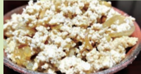
玉葱とチッコカタメターノの煮物

江戸幕府直轄牧である嶺岡牧は、原動力である馬の生産基地であると同時に、8代将軍徳川吉宗が国民の寿命を延ばすため酪農をはじめた日本の酪農発祥地でもある。今日の牛乳・乳製品のある食卓は、嶺岡牧から始まっている。そうした歴史に育まれた食物がチッコカタメターノ(乳って固めたの)。嶺岡地域で、100に及ぶチッコカタメターノ料理を確認。この地域食を活かしてより豊かな鴨川の食生活を実現するため“プロジェクト鴨川味の方舟”では、美味しいチッコカタメターノ料理を作る教室を開いている。