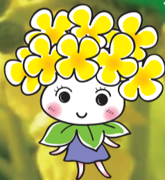
ななちゃんは、鴨川市のイメージキャラクターです。

かも春の風物詩——菜な畑ロードが今年も登場する。広さは一万坪に拡大!一足早い春を感じながら、幸せの黄色に包まれよう。