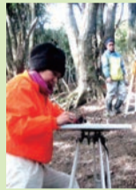
嶺岡牧の調査風景