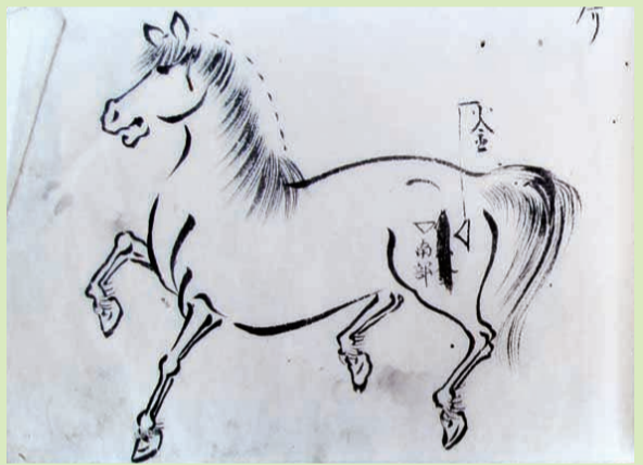
古文書に描かれた馬(石井家文書)

鴨川市田原の石井家に伝わる江戸時代の古文書『佐倉 小金 愛鷹 峯岡 牧焼印之覚』に描かれた馬をジッと見ていると、馬が紙面から出てきて、私に着いてくるように思えてくる。たてがみと尻尾は繊細に描かれているが、馬の姿は1本の線で描いているにすぎない。にもかかわらず、いきいきとした馬の動き、さらには体温、息遣い、足音が感じられ、肩に顔を着けられた時の感触や臭いを思い起こさせる。馬とともに暮らす日々を送っていたからこそ描けた絵といえよう。 田原の石井家など、嶺岡牧を管理していた“牧士”の家を中心に、嶺岡牧に関する古文書が2万点近く残っている。これらを丹念に読み解き、嶺岡牧遺跡に関する考古学研究を補完することで、徳川幕府直轄4牧で唯一全貌が残されており、日本酪農のルーツでもある「日本の宝 嶺岡牧」の実態に迫っていきたいと思っている。