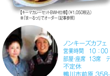
【キーマカレーセットBWH仕様】(¥1,050税込) ※「まーるっ!」でオーダー(記事参照)

さて、オリジナルとBWH仕様はどういった差異があるのか。オリジナルはソースに隠れて半熟の目玉焼きが載せられているのだが、BWHの方は逆なのだ。ソースの上に目玉焼きが載る、いわゆるロコモコ風なのである。