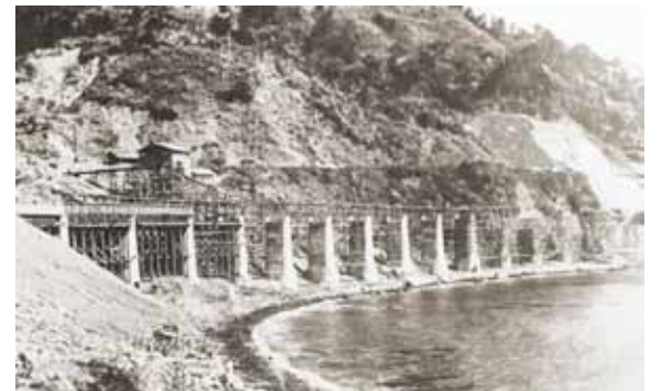
全長164.7m 脚高最大11.2m 橋脚15本