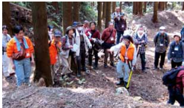
柱木牧の馬捕り場はどこから馬を追い込んだのだろうか？

そこで、私達は、嶺岡牧を広く知って頂くため、嶺岡牧を歩き、現地に立って嶺岡牧を考えることを重視した。2012年度は、嶺岡西牧1回、嶺岡東牧4回、柱木牧3回、計8回嶺岡牧を歩く機会を設けた。参加者個々の興味を基本に据え、マイクは使用せず、ファシリテータ1人で対応する人は最大でも8人とし、コミュニケーションを密に図った。参加者は、嶺岡東牧、嶺岡西牧、柱木牧では牛馬の飼養様式が大きく異なること、嶺岡牧は単に軍馬育成や嶺岡白牛酪製造のための牧でなく、江戸の入口を守る馬城であったことを肌で感じ取っていた。2013年度は、毎月異なるテーマで嶺岡牧を歩くことを予定している。