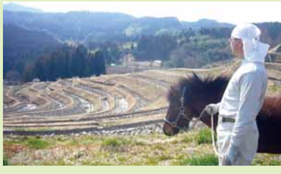
▼引き馬の訓練に、山の中の旧道を越えて大山千枚田までお散歩

このところ学校やスポーツ界での体罰問題のニュースが続きました。これって同じことではないのかなあ・・・。