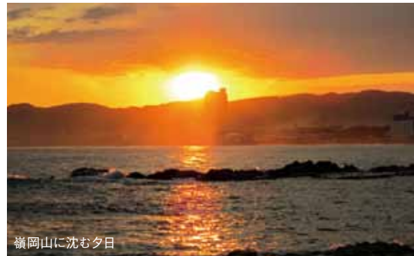
嶺岡山に沈む夕日