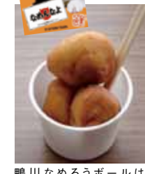
鴨川なめろうボールはイベント販売専用です。

『なめろう』を手軽にいつでも食べられるようにと、「なめろう」を一口サイズに丸めてコロモで揚げるという新発想の料理でしたが、これが思いのほか美味しく、試験的に販売した7月8日のロッテマリーズ鴨川マッチデーの時には、準備した300食分が試合開始前には完売してしまう程の人気!その後10月に行われた「ラグリンまつり」では200食が完売、ロッテマリーズの鴨川秋季キャンプでも200食が完売となる人気商品となりました! これからも鴨川市商工会青年部では、鴨川の魅力と『鴨川なめろうボール』の美味しさを皆さんに伝えていきます!