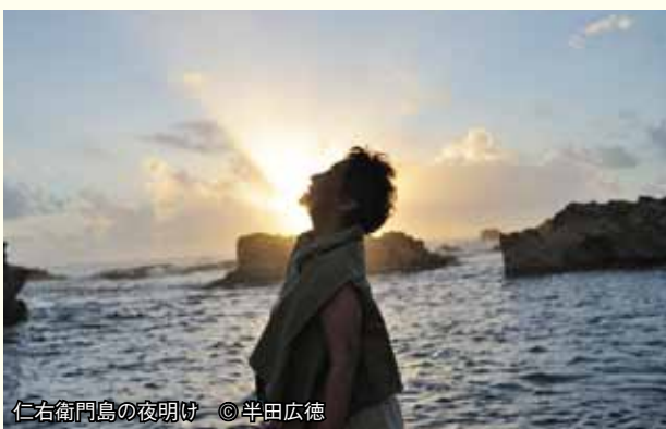
仁右衛門島の夜明け

これらの鴨川代表おらが井は、市内各イベントでの出品販売致します。ぜひ皆さまも、イベント会場で味わって下さい!