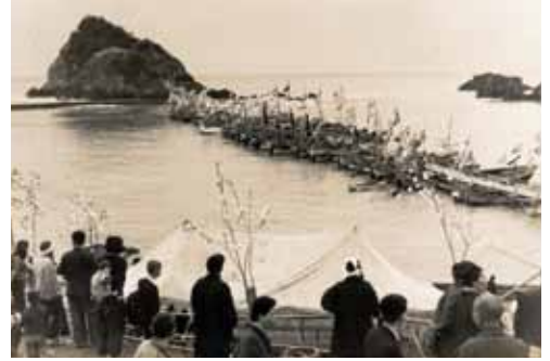
昭和28年の本開帳の様子

御開帳が何時頃から行われていたのか定かではありませんが、厳島神社は、平安時代の承和年間(834~847)に慈覚大師によって弁財天女の尊像が安置されたことに始まると伝えられています。