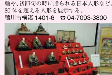
「桃の節句(ひなまつり)」にあわせて、江戸時代と推定される古い雛人形を中心に、紙でできた雛人形、明治から昭和にかけての親玉飾りや段飾り、雛人形の描かれた掛軸や、初節句の時に贈られる日本人形など、80体を超える人形を展示する。 鴨川市横渚 1401-6 ☎ 04-7093-3800