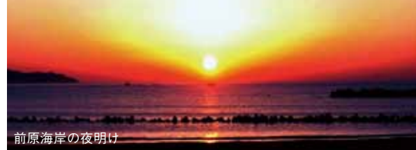
前原海岸の夜明け