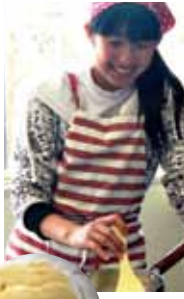
▲嶺岡酪づくり体験 ▼嶺岡酪

われる白牛酪で、それまでの酪とは砂糖を使う点で大きく異なる。徳川家齊は、白牛酪の栄養的優秀性を医師桃井寅に記させ、その普及を図っている。こうして、家齊以降急速に嶺岡酪は牛牧化していった。千葉県酪農のさどでは、「嶺岡酪まるごと体験」のなかで嶺岡酪をつくるなど、こうした嶺岡の歴史的個性、及び嶺岡酪の重要性を肌で感じられる現地展示・体験展示を進めている。