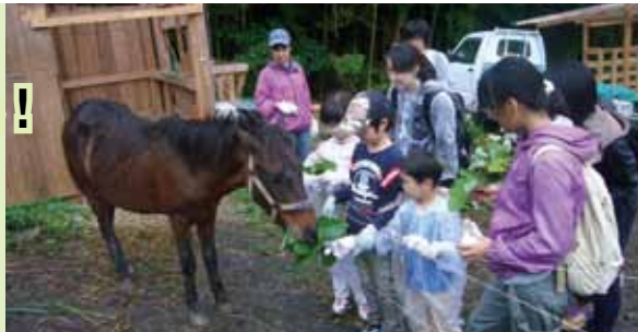
▲はい、どうぞ。ごちそうにタックは大喜び。

11月、震災直後から地域の仲間たちと取り組んで来た鴨川市大山支援村の活動で、福島市から15人の親子を迎えました。旧大山小学校校舎での受け入れとしては最後となるお客様でした。「福島市小鳥の森」という森林公園の野外活動クラブに参加してきた子どもたちに、外遊びを思いっきり楽しんでもらおうという企画でした。待ち構えているタックの口元に、子どもたちが手にしたクズの葉っぱを差し出します。最初はおそるおそる。じきに競うようにして、草の中でもいちばんの好物のクズ