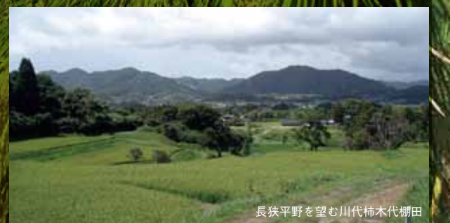
長狭平野を望む川代柿木代棚田

現在53組のオーナーが登録されている川代棚田。川代棚田の最大の魅力はその眺望にある。長狭街道や鴨川富士を一望でき、一部の田んぼは圃場整備されたにも関わらず、きれいな棚田に見える景色はまさに絶景。田植えや稲刈りはもちろん人力。草刈りも毎月1回行うという手の入れよう、農薬をほとんど使わず、天然の湧水を使い稲を育てる。毎年10月に行われる収穫祭には、自分たちの手で育て上げたお米を使い、カレーやおにぎりを作り、それを頬張る老若男女でにぎわう。川代は立地上、山の幸あり、海の幸あり、天然の湧水ありで、セカンドハウスを考えている方にはおススメの場所だ。オーナー制度共通の問題、「後継者」に対し、「若者たちの農業に対するイメージ改善が大切。」と語る。