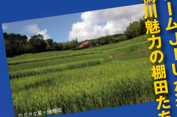
のどかな星ヶ畑棚田