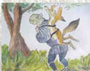
(「鴨川のむかし話」鴨川市教育委員会発行より)

二人が寝ている間に狐は逃げ出しましたが、数日後、やぶの中で死んでいるのが見つかりました。おじいさんと戦ったときにできた傷がもとで死んだのでしょ。よいちろうさんは、たたりをおそれこの狐を大事に葬りました。それから村では、こを「狐塚」といつくじになったといわれています。