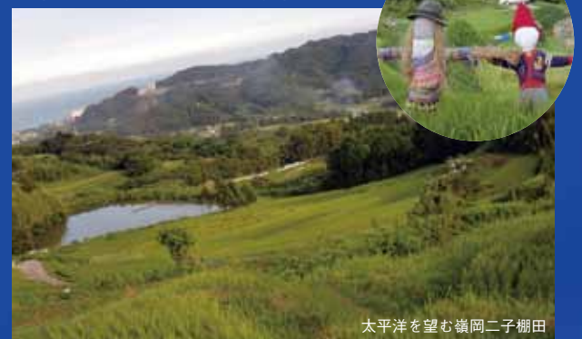
太平洋を望む嶺岡二子棚田