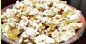
玉葱とチッコカタメターノの煮物