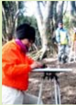
嶺岡牧の調査風景