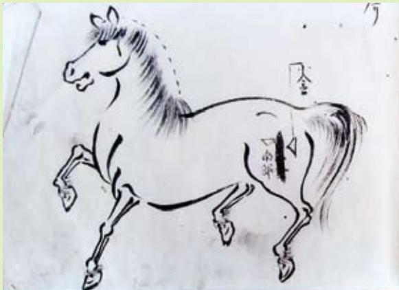
古文書に描かれた馬(石井家文書)

田原の石井家など、嶺岡牧を管理していた“牧士”の家を中心に、嶺岡牧に関する古文書が2万点近く残っている。これらを丹念に読み解き、嶺岡牧遺跡に関する考古学研究を補完することで、徳川幕府直轄4牧で唯一全貌が残されており、日本酪農のルーツでもある「日本の宝 嶺岡牧」の実態に迫っていきたいと思っている。