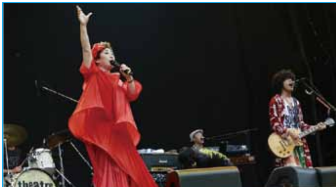
フジロックのステージで佐藤タイジと

は、是非みなさん気軽に遊びに来てください。 是非みなさん気が、そろそろ臨月なのでハラハラです。 十月二十七日は鴨川自然王国で秋の大収穫祭を開きます。たくさんのお店、おいしいランチとライブが楽しめます。 鴨川自然王国で秋の大収穫祭を開きます。たくさんのお店、おいしいランチとライブが楽しめます。