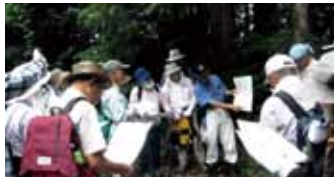
嶺岡牧再生アカデミー

お詫びと訂正 前号(かも春号)にて「東牧」のルビを「とうほく」と表記しましたが、正しくは「ひがしまき」の誤りでした。ここに訂正してお詫び申し上げます。(編集部)