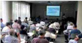
牧の文化再生プラットフォーム