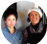
「nonkey'surf&sports」店長さんの、奥さん(右)と娘さん(左)がお店を切り盛り。

営業時間 10:00~19:00(ラストオーダー) 部屋・座席 13席 テーブル席、カウンター席、テラス席 不定休 鴨川市前原 358-34 2階 ☎ 04-7094-5173 http://www.nonkey.net/