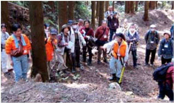
柱木牧の馬捕り場はどこから馬を追込んだのだろうか？

2010年度から始めた嶺岡牧基礎調査で、嶺岡牧の外周の半分強に相当する36kmの野馬土手が廻っていることを確認した。そのほとんどが鬱蒼とした荒れ山にあるため、多くは映像をみても何を撮影しているのかさえ分からないし、希に野馬土手の姿がよく分かるものでも、どんなところに野馬土手はつくられているのか、どのような状態にあるのか等を総合的に捉えることは難しい。しかし、現地に立ち、野馬土手など嶺岡牧に残された遺構をみると、嶺岡牧に馬や白牛がいた頃の様子を容易にイメージすることができる。 そこで、私達は、嶺岡牧を広く知って頂くため、嶺岡牧を歩き、現地に立って嶺岡牧を考えることを重視した。2012年度は、嶺岡西牧1回、嶺岡東牧4回、柱木牧3回、計8回嶺岡牧を歩く機会を設けた。参加者個々の興味を基本に据え、マイクは使用せず、ファシリテータ1人で対応する人は最大でも8人とし、コミュニケーションを密に図った。参加者は、嶺岡東牧、嶺岡西牧、柱木牧では牛馬の飼養様式が大きく異なること、嶺岡牧は単に軍馬育成や嶺岡白牛酪製造のための牧でなく、江戸の入口を守る馬城であったことを肌で感じ取っていた。2013年度は、毎月異なるテーマで嶺岡牧を歩くことを予定している。