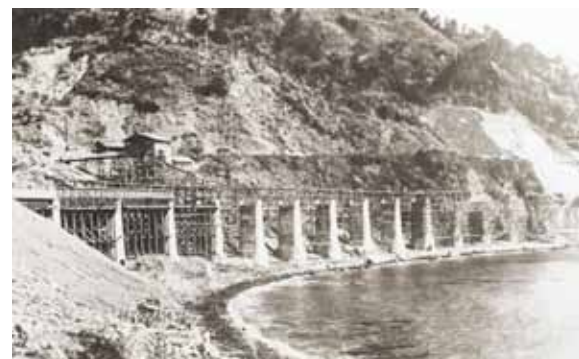
全長164.7m 脚高最大11.2m 橋脚15本