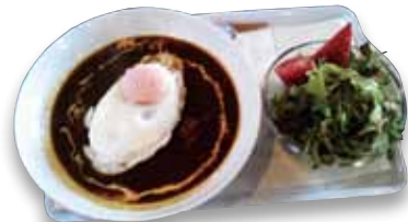
【キーマカレーセットBWH仕様】(¥1,050税込) ※「まーるっ!」でオーダー(記事参照)

さて、オリジナルとBWH仕様はどういった差異があるのか。オリジナルはソースに隠れて半熟の目玉焼きが載せられているのだが、BWHの方は逆なのだ。ソースの上に目玉焼きが載る、いわゆるロコモコ風なのである。ともあれファンにとっては作品世界と現実がリンクする楽しいランチになることだろう。