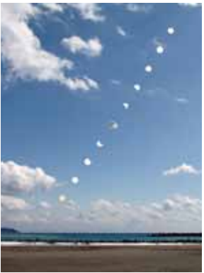
前原海岸ハートランド前から見た金環日食のイメージ