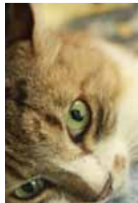
『にやに?』 3年5組 鈴木穂奈弥

千葉県立長狭高校に写真部があるのをご存じだろうか？最近5年間の全国大会は連続出場している強豪であり、今年8月に福島で行われた全国大会にも3作品が選出された。写真部の活動場所は基本的に鴨川で、自然風景や日常風景を撮影しているとのこと。また、2か月に一度は鴨川に出ることもあるそうで、過去には鎌倉や上野動物園などで撮影を行い、感性を磨いているそう。身近な鴨川を写し出す高校生の写真には、斬新な感性によって発見された新しい鴨川の姿がある。そんな描写が評価され全国大会に名を連ねているのであろう。写真部が撮影した写真はJR安房鴨川駅の跨線橋に展示されていることもあるので、通った際はぜひ注目してみてください。KamoZineの表紙を飾る日も近い!?