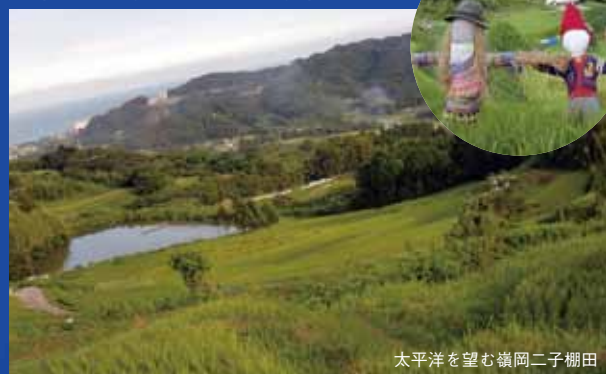
太平洋を望む嶺岡二子棚田

鴨川二子棚田保存会 http://futagotanada.blogspot.com/