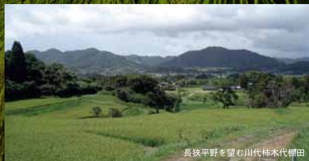
長狭平野を望む川代柿木代棚田

現在53組のオーナーが登録されている川代棚田。川代棚田の最大の魅力はその眺望にある。長狭街道や鴨川富士を一望でき、一部の田んぼは圃場整備されたにも関わらず、きれいな棚田に見える景色はまさに絶景。田植えや稲刈りはもちろん人力。草刈りも毎月1回行うという手の入れよう、農業をほとんど使わず、天然の湧水を使い稲を育てる。毎年10月に行われる収穫祭には、自分たちの手で育て上げたお米を使い、カレーやおにぎりを作り、それを頬張る老若男女でにぎわう。川代は立地上、山の幸あり、海の幸あり、天然の湧水ありで、セカンドハウスを考えている方にはおすすめの場所だ。オーナー制度共通の問題、「後継者」に対し、「若者たちの農業に対するイメージ改善が大切。」と語る。