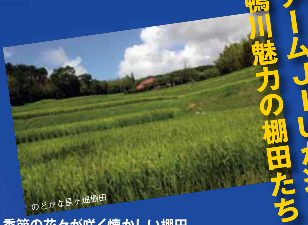
のどかな星ヶ畑棚田