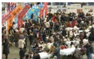
第1回サミット風景

会場では、ステージイベントとして、「全国各地おしご当地井会議」「井好き有名人のトークショー」「有名人による井レシビ披露と試作会」などが実施予定。あわせて、ご当地井のミニ井即売会や物産品販売等も行われ、ご当地井事業を行う参加団体が地域の食材を活かした井料理のPR及び販売を通して、地域の魅力を全国へ発信します。