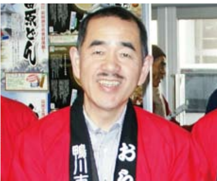
山本 益博（やまもと ますひろ）

1948（昭和23）年に東京の下町、浅草・永住町（現在の台東区元浅草）に生まれる。1982年、「東京・味のグランプリ200」を講談社より出版し、料理を作る研究家としてではなく、「毎日、外で食べていれば食っていける」という不思議な職業「料理評論家」を確立。長年にわたるフランス料理を紹介する仕事で評価され、2001年にはフランス政府より「農事功労勲章シュヴァリエ」を受勲。「美味しいものを食べるより、ものを美味しく食べる」をモットーに食卓を共にする時間を楽しむ「食時会」や生産者を講師に招いての食材塾を開催。