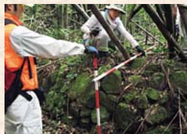
野馬土手の調査の進む嶺岡牧

〈お問合せ〉 鴨川市企画政策課 ☎ 04-7093-7828 嶺岡牧から学ぶ会 http://www.mineokamaki.org